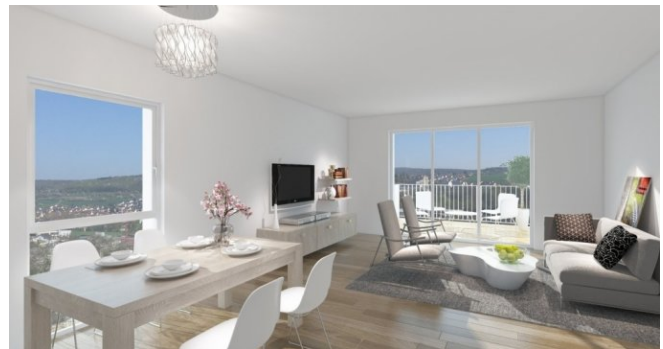
Wohnen mit Aussicht